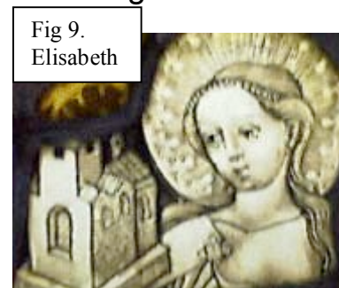
Fig 9. Elisabeth

Den heliga Elisabeth firas den 19 november i hela den katolska världen.