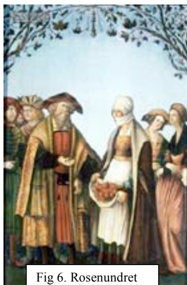
Fig 6. Rosenundret

”Rosenundret”, som är Elisabeths mest berömda, finns märkligt nog inte beskrivet varken i levnadsbeskrivningarna eller i legendsamlingen: