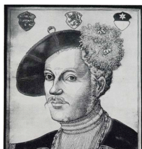
Fig 8. Filip av Hessen

Lantgreven, och ivrige protestanten Phillip av Hessen lät 1539 ta bort hennes