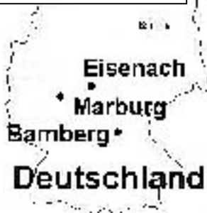
Fig 3. Tyskland

Redan när Elisabeth var fyra år blev hon bortförlovad med den då elvaårige Herrman, son till lantgreven av Thüringen. Detta som ett resultat av politiska påtryckningar från påven Innocentius III. Elisabeth blev genom sin blivande svärmor Sophie hämtad till slottet Wartburg nära Eisenach i Thüringen för att få en grundlig tysk uppfostran. Dock höll planerna på att spricka eftersom det inte bar sig bättre än att Hermann dog 1216 och hans pappa ett år senare.