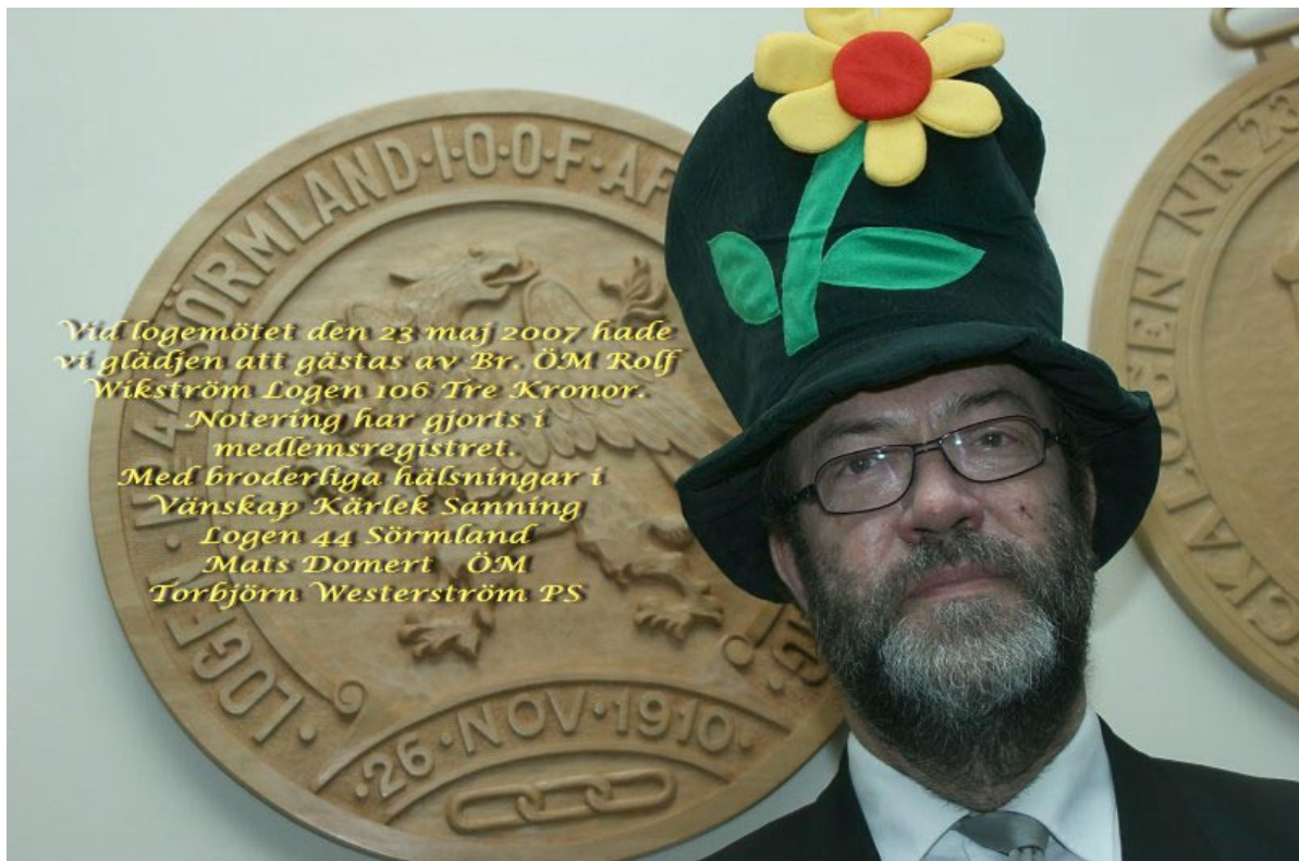
Br ÖM hos B44 Sörmland i Nyköping