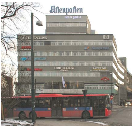
Odd Fellow huset

I Oddfellowhuset i Oslo har Norska Storlogen, 10 brödraloger, 9 Rebeckaloger, 2 brödraläger och 2 Rebeckaläger sitt säte. Huset ägs helt av institutionerna. Huset byggdes av Odd Fellow och invigdes 1936,