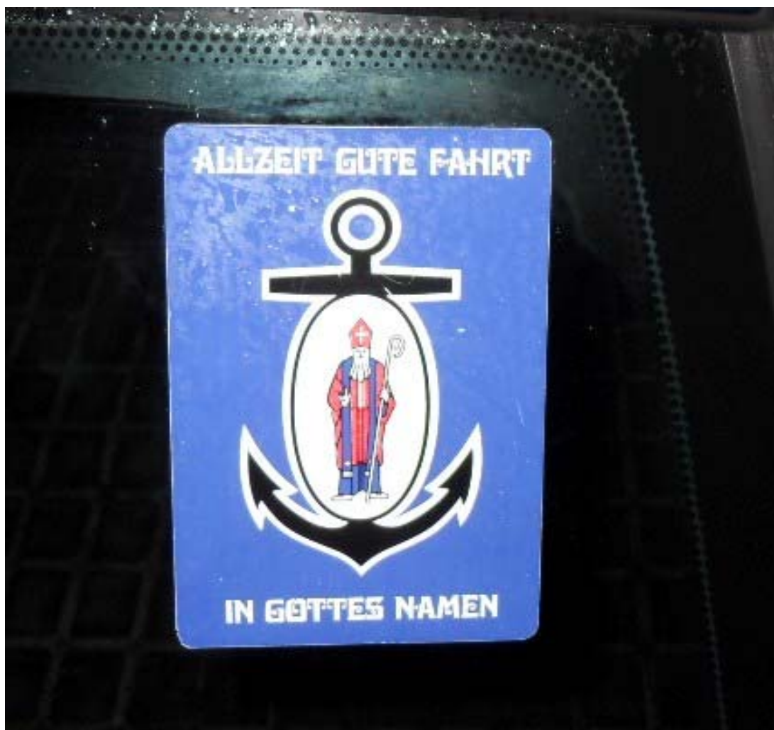
Modern framställning av Sankt Nikolaus (bildekal från Österrike)