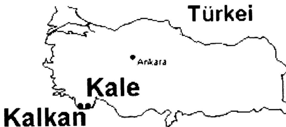
Myra l g ungef r mellan Kale och Kalkan