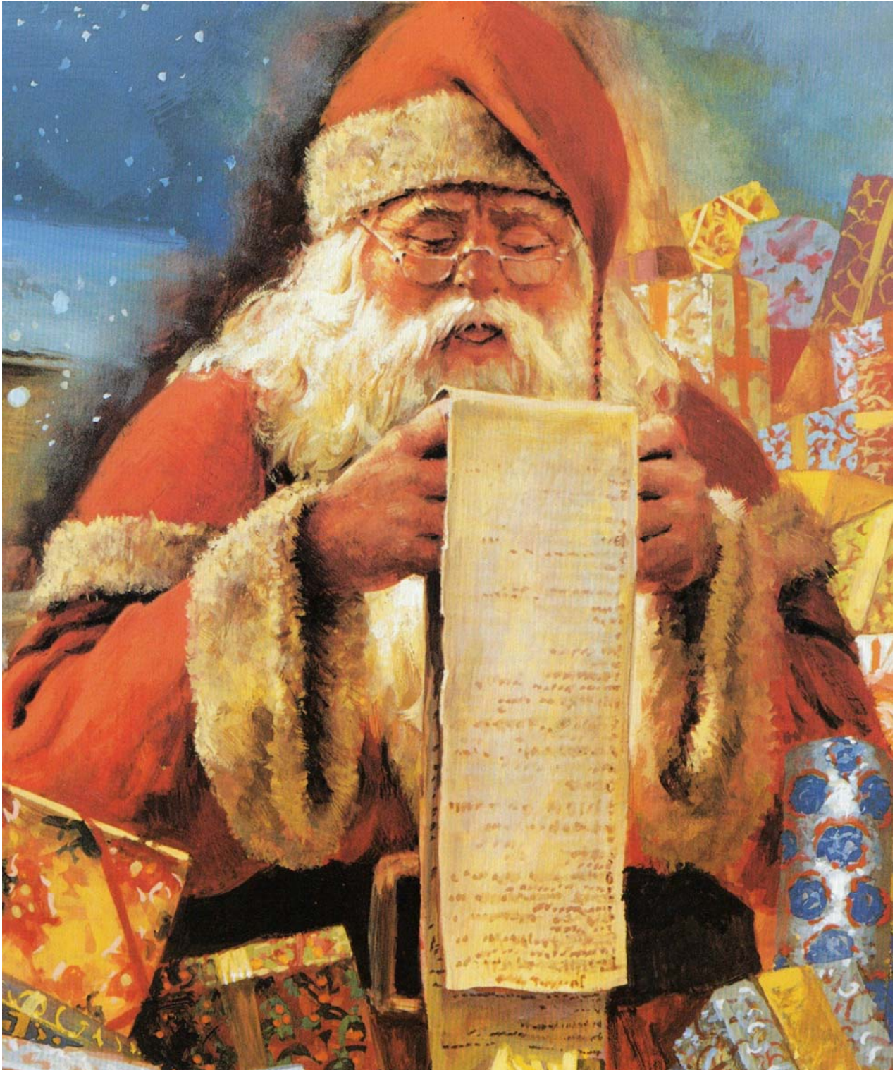
Jultomten som jag tror att han ser ut