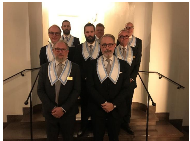
Här ser vi samtliga 8st nygraderade bröder i 2a Graden i trapphallen upp till Bäckströmska.

till sig och som vi alla, lite till mans, behöver tänka på inte minst vid den högtid som stundar inom kort.