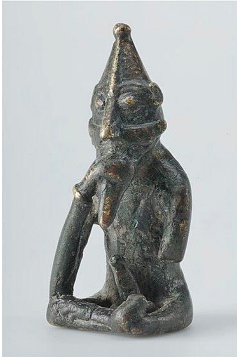
Statyett med tydlig fallos som anses föreställa Frej ("Rällinge-statyetten"). Daterad till 1000-talet, funnen i Rällinge i Sverige.

Varifrån traditionen stammar är omdiskuterat men har ofta kopplats till de blotriter där man offrade vildsvin till Vanerguden Frej, som starkt förknippades med djuret.