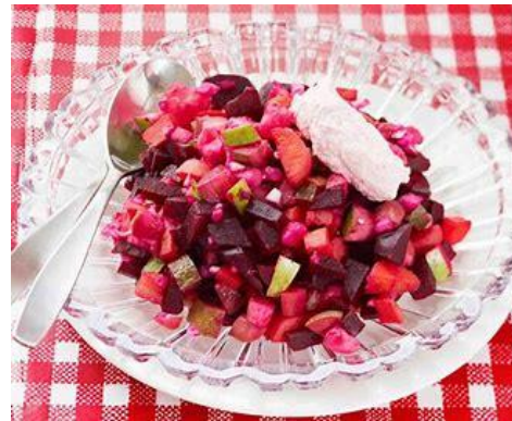
*Rosoll = Finsk sillsallad, påminner starkt om Svensk dito.

I Polen äter man skinka och olika korvar först på juldagen. Traditionen att servera skinka till jul förekommer bland annat även i USA, Kanada och Australien.