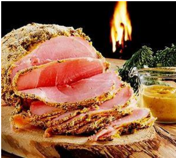
Typisk julsinka m tillbehör

Kravmärkt julsinka får däremot inte innehålla nitrit. Den är därför gråare i färgen och har kortare hållbarhet.